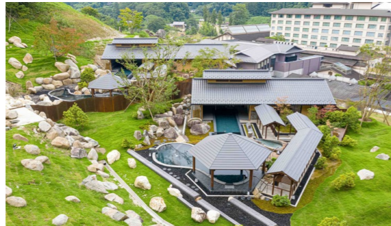
母畑温泉 八幡屋 帰郷邸