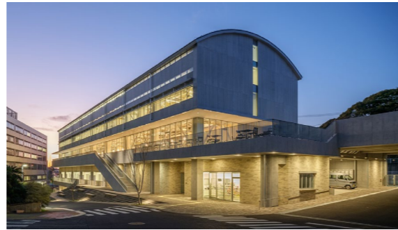
東京科学大学 大岡山西5号館