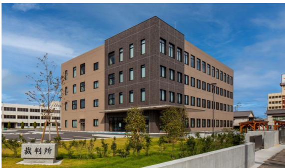
広島地方・家庭裁判所 福山支部・福山簡易裁判所