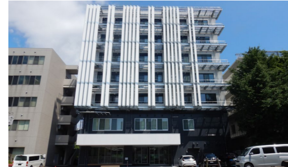
Tokai Open Innovation Complex