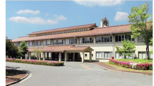
吉備高原医療リハビリテーションセンター