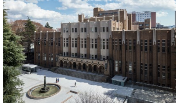
東京大学 総合図書館