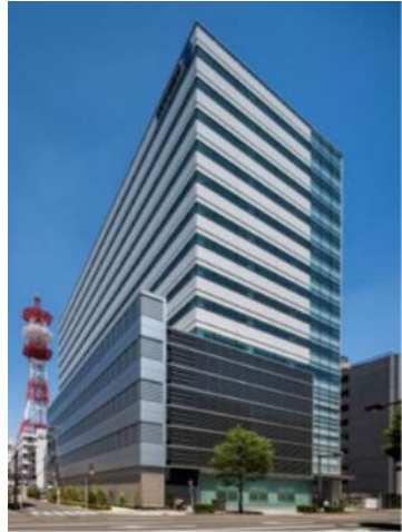
NTT東日本 仙台青葉通ビル