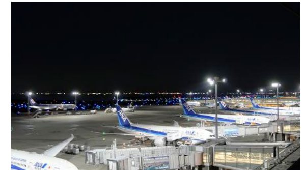
航空灯火・空港エプロン照明灯