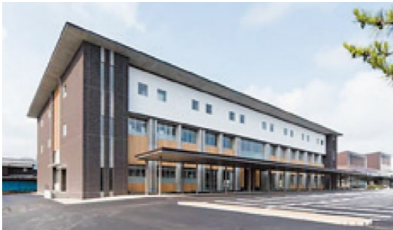
萩市総合福祉センター