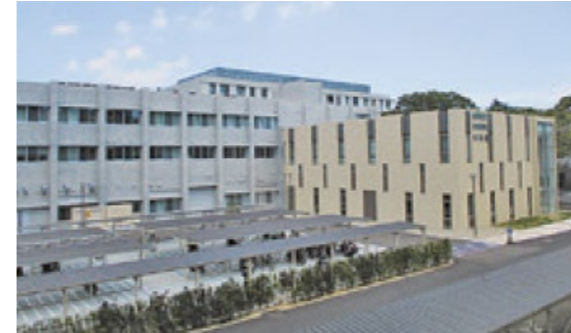
東北大学 実験研究棟