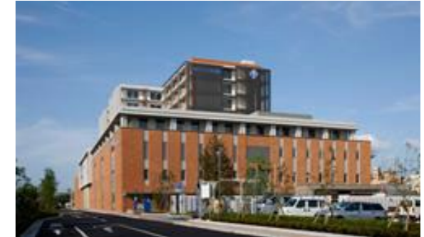
淀川キリスト教病院