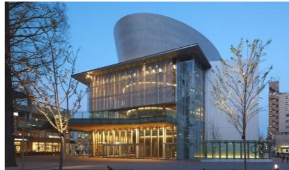
アクエル武蔵小金井